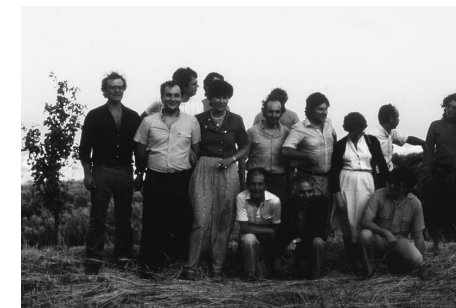
Die Gründer von BBJ in Kalabrien